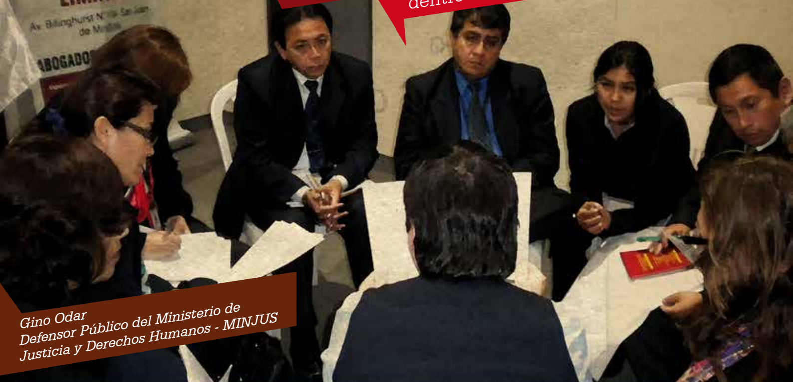
Gino Odar Defensor Público del Ministerio de Justicia y Derechos Humanos - MINJUS

en la declaración policial, dentro de la Justicia Juvenil Restaurativa